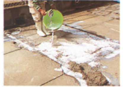
標準混合比率(重量比)

③モルタル接着補強用の混合液(フラットタイト®P1:水2の割合)を下地のモルタル面に塗布してから、先に調合したモルタルを打設する。