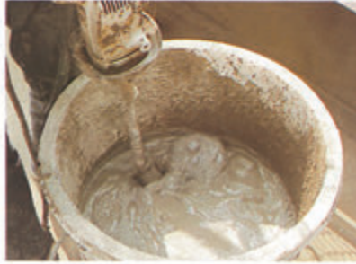
標準混合比率(重量比)