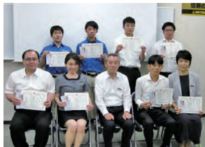
2019年度QCサークル全社大会&工場見学会(四国工場)