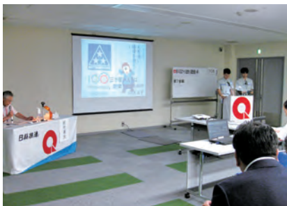
2019年度QCサークル全国大会(神戸)

三ツ星ベルトグループの各拠点から選抜されたサークルがインドネシアに集結し、2019年度三ツ星ベルトグローバルQCサークル大会が行われました。参加者は一同、同じ衣装をまとって大会に参加し、一体感のある大会となりました。また、各拠点の活動内容を共有するなどの交流が生まれ、有意義な場となりました。