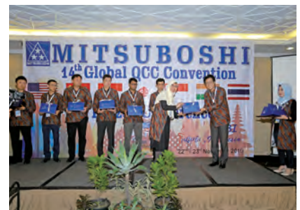
2019年度三ツ星ベルトグローバルQCサークル大会(インドネシア)

三ツ星ベルトグループの各拠点から選抜されたサークルがインドネシアに集結し、2019年度三ツ星ベルトグローバルQCサークル大会が行われました。参加者は一同、同じ衣装をまとって大会に参加し、一体感のある大会となりました。また、各拠点の活動内容を共有するなどの交流が生まれ、有意義な場となりました。