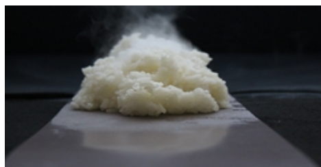
【炊き立てごはんの搬送例】

②炊き立てのごはんなど高温で粘着性のある搬送物に最適。耐熱性・離型性に優れた「フッ素コーティングベルト」の発売を開始致します。