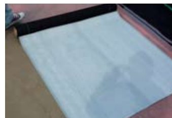
塗布面が巻き内側