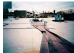
接着剤を塗布する際に風によりシートが煽られた現場